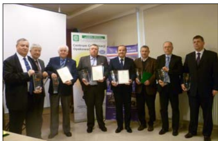
Wręczenie nagród i wyróżnień

Obrady Walnego Zgromadzenia Członków Polskiej Izby Opakowań. Ocena działalności Izby. Udzielenie absolutorium organom Izby. Przyjęcie programu i budżetu Izby na 2014 rok. Uchwalenie wysokości składek członkowskich na 2015 rok. Wręczenie nagród i wyróżnień osobom i firmom zasłużonym dla przemysłu opakowań. Wręczenie certyfikatów członkostwa. Prezentacja firm – nowych członków Izby.