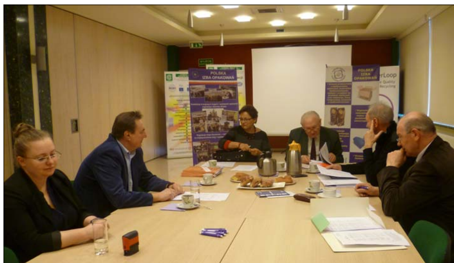
Posiedzenie Komisji Rewizyjnej

Komisja Rewizyjna po wnikliwym rozpatrzeniu: „Sprawozdania Prezesa Izby z działalności w 2014 r.”; „Sprawozdania z działalności finansowej Izby w 2014 r.”; „Sprawozdania Rady Izby w 2014 r.”; projektów „Programu działalności Izby w 2015 r.” oraz projektu „Budżetu Izby na rok 2015”, pozytywnie oceniła działalność